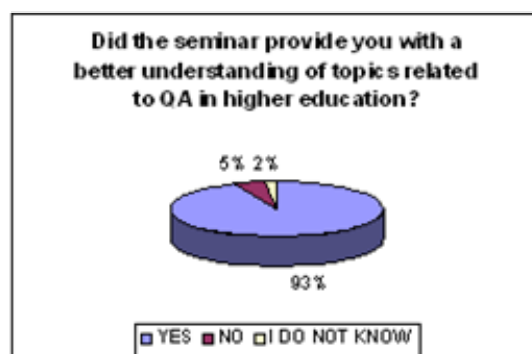
Slika 2. Obradeni rezultati na jedno od pitanja u vezi sa organizacijom seminara