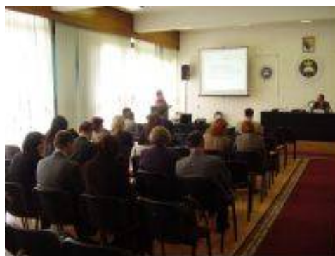
Slika 1. Dio atmosfere sa seminara